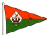
Fareham Sailing and Motor Boat Club