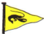
Warsash Sailing Club